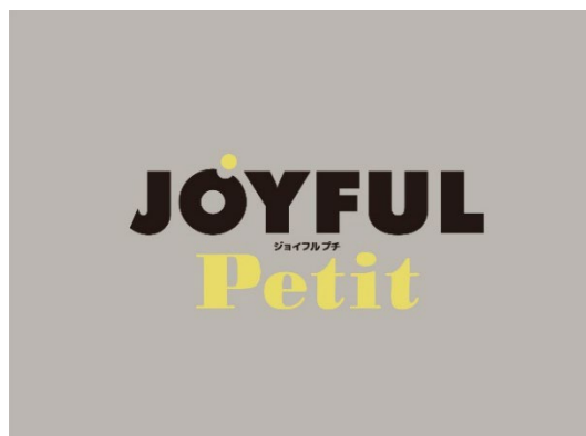
JOYFUL Petit ロゴマーク

ポップアップストア「JOYFUL Petit（ジョイフル プチ）」の出店は、当社の女性社員の提案からスタートし、そのマーケティングから出店の具体的な企画立案、店舗の運営方法までの全てを本委員会の女性メンバーが中心となって進行したダイバーシティ推進社外プロジェクトの第一弾となります。